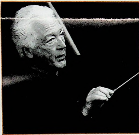
Leidenschaftlicher Musik-Autographensammler, Entdecker vieler vergessener Oper, als Dirigent und Kenner des Belcanto zusammen mit Joan Sutherland einer der Mitbegründer der Belcanto-Renaissance, Richard Bonyngé CBE.

Sa 2., Sa 9., Mi 13., Fr 15. Juli 19.40 · Kurhaus