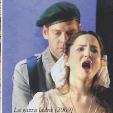
La gazza ladra (2009)

spielte Oper wird hier in einer erlesenen Besetzung konzertant vorgestellt. Primadonna Jessica Pratt darf man als Protagonistin dieser dramatischen Aufführung nicht versäumen!