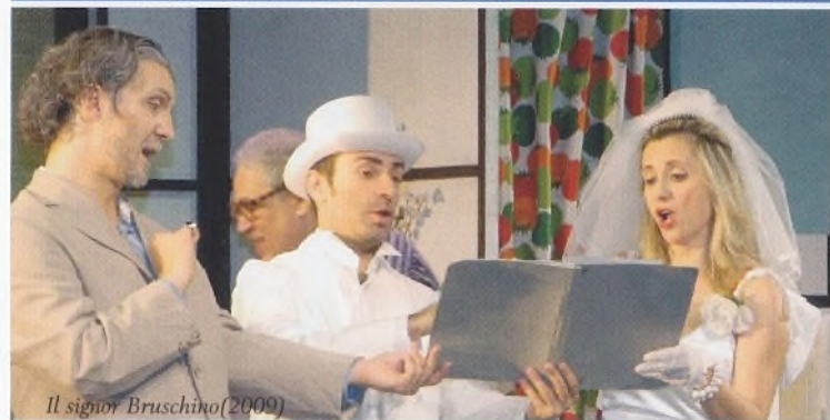
Il signor Bruschino (2009)

... zu ROSSINI IN WILDBAD 2010! Werke aus allen drei Schaffensphasen Rossinis, berühmte große und herausragende junge Künstler, ein neuer Spielort, mehr Plätze und bessere Sicht: So lässt sich das Festival 2010 in Kurzform beschreiben. Die frisch renovierte Trinkhalle und das Kurtheater bieten nicht nur mehr Sitzkomfort, sondern auch eine komfortablere Foyer-Situation.