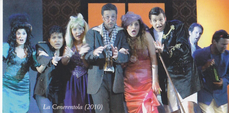
La Cenerentola (2010)