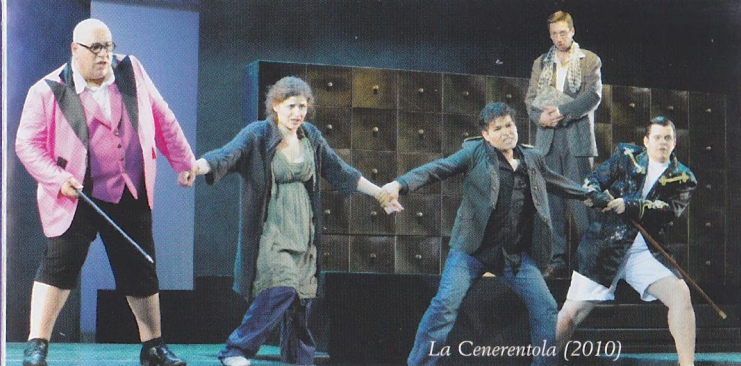
La Cenerentola (2010)

Diese Oper in zwei Akten von Stefano Pavesi war nach ihrer Premiere an der Mailänder Scala 1810 jahrelang ein Renner und kam sogar für durchgefallene Rossini-Opern (!) als siche-