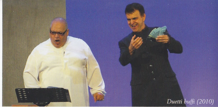
Duetti buffi (2010)