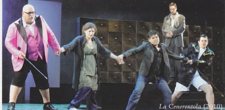
La Cenerentola (2010)