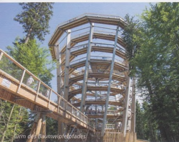
Turm des Baumwipfelpfades

Auf nach Bad Wildbad! Ihr Jochen Schönleber, Intendant