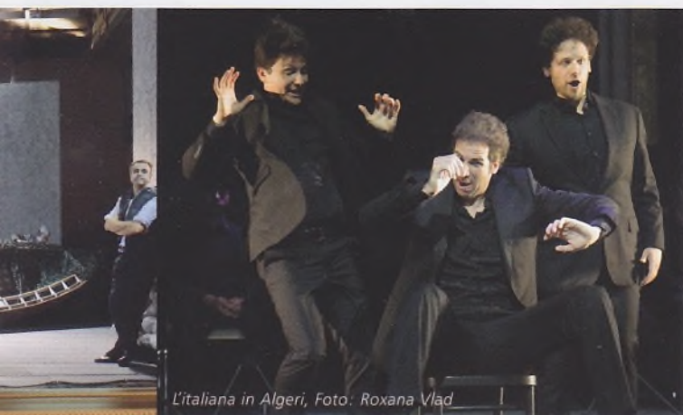
L'italiana in Algeri

Die zweite Oper in der kurzen Lebens- und Schaffenszeit von Vincenzo Bellini war sein erster offizieller Opernauftrag und wurde 1826 von dem legendären Impresario Domenico Barbaja am Teatro di San Carlo herausgebracht. Weil der König in Neapel Ferdinando hieß, musste der