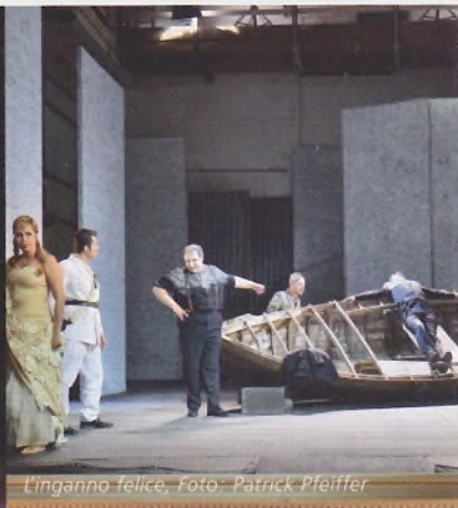
L'inganno felice