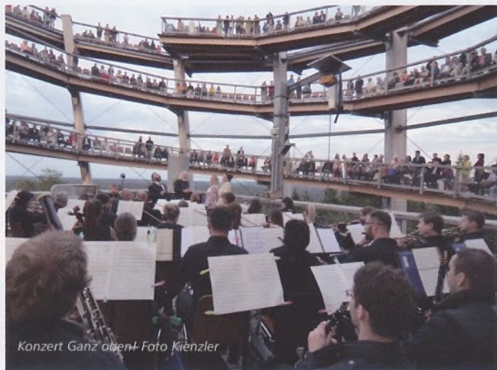
Konzert Ganz oben!