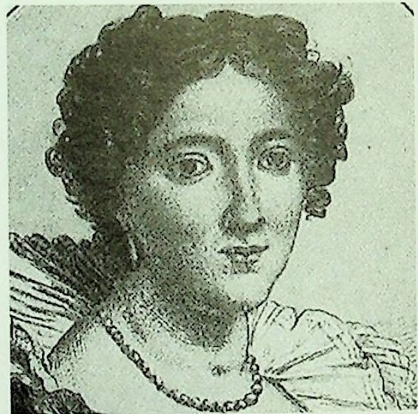
Maria Malibran Marietta Marcolini Rosamunda Pisaroni Isabella Colbran Giuditta Pasta