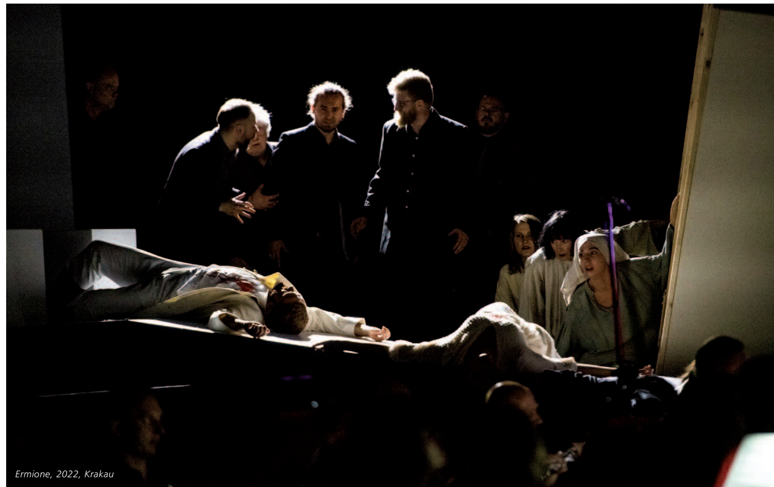
Ermione, 2022, Krakau

Ein besonderes Erlebnis ist das Konzert mitten im Hochwald auf dem Sommerberg. Die hohen Bäume strahlen den Ton in unvergleichlicher Weise ab und so ist hier Platz für großes, festliches Repertoire, darunter Rossinis Hymne à Napoléon III , die kurze Kantate De l'Italie et de la France und Ausschnitte aus Guillaume Tell . Im Rahmen dieses Konzerts wird auch die Inge-Borkh-Stipendiatin 2023 vorgestellt. Diese Auszeichnung wurde zur Erinnerung an die großartige Sopranistin von privaten Mäzenen gestiftet, denen unser herzlicher Dank gilt. Für Gäste, die nicht so gut zu Fuß sind, wird ein Shuttleservice angeboten, alle anderen genießen einen Spaziergang durch den Wald. Für Familien gibt es ein spezielles Angebot, siehe Homepage und Tagespresse.